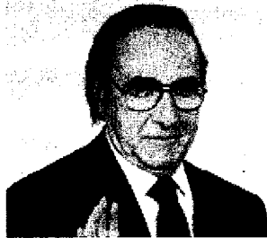
Pippo Baudo 71 anni