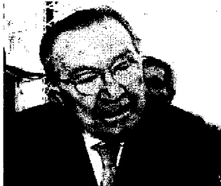
Giulio Andreotti 89 anni