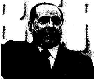
Silvio Berlusconi 71 anni