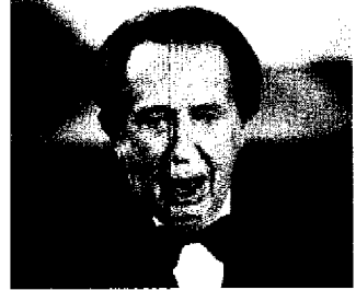
Mike Bongiorno 83 anni